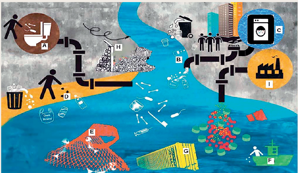
Kilder til plastaffald i havet

Mikroplast i havet kan komme mange steder fra. Noget bliver smidt eller blæser derud. I havet nedbryder vand og sollys langsomt platten til mindre dele. Med tiden bliver det til mikroplast. Mikroplast i havet kan også stamme fra bildæk, vejstriber og skosåler. Det slides af, når vi kører bil og går, og regnen skyller platten ud i vandløb. Mikroplast kan også komme fra fx creme, tandpasta og tøjvask.