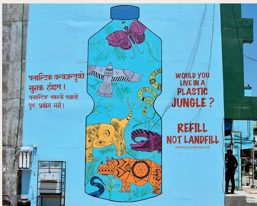
Vil du leve i en plastikjungle? Gavlmaleri fra Chitwan i Nepal